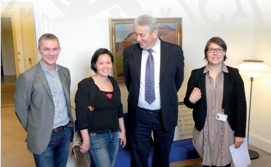
Fyri fyrstu ferð hevur verið samstarv millum allar norðuratlantisku fólkatingslimirnar

Síðani er hvør dagur brúktur til at fremja hetta í verki. Og tað hevur gagnað føroyska samfelagnum.