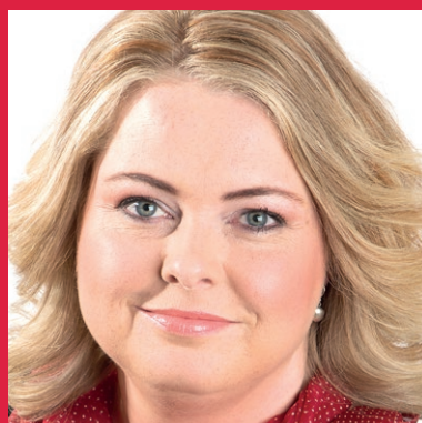
Rigmor Dam Tórshavn